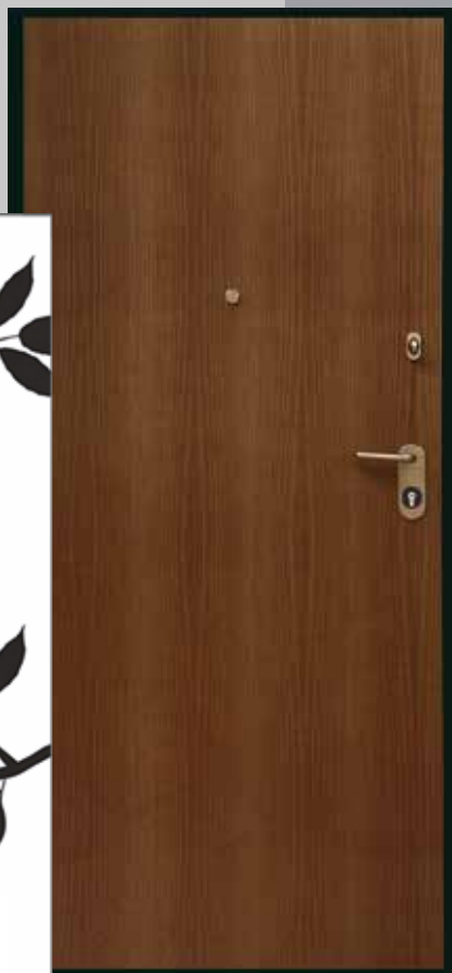
▶ BLINDATO ◀ ARMORED DOOR