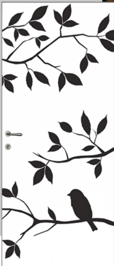
▶ FILOMURO ◀ INVISIBLE FLUSH-WALL DOOR