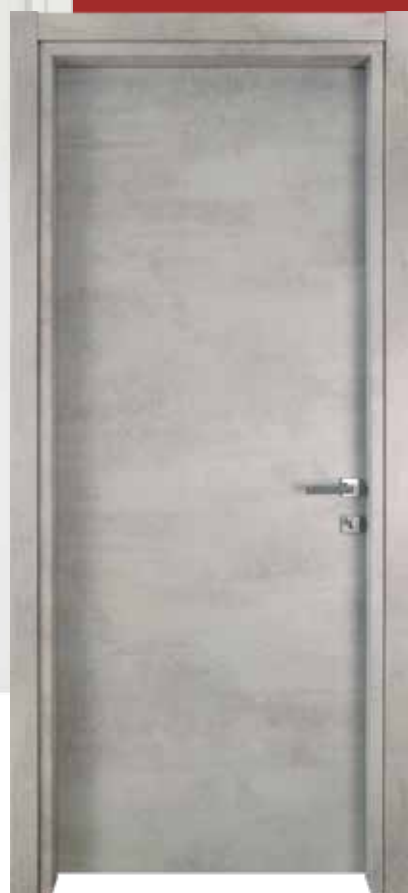
▶ TENDENZA ◀