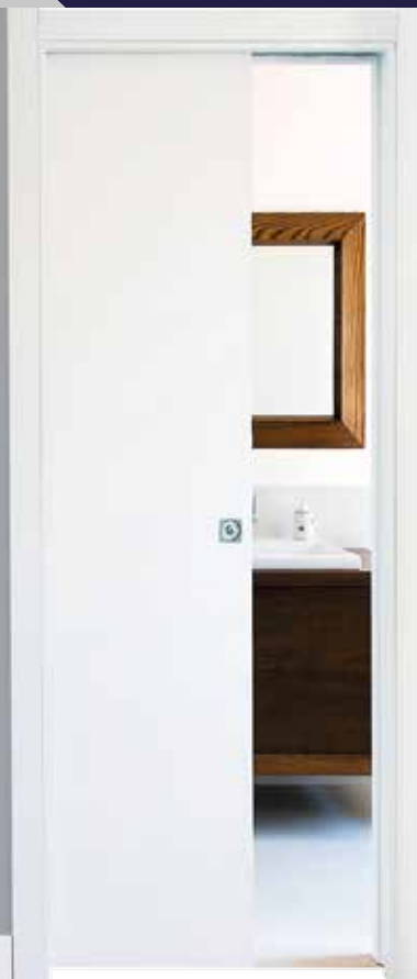
▶ CONTROTELAIO PER SCORREVOLE ◀ BOXES FOR INTERNAL SLIDING DOORS