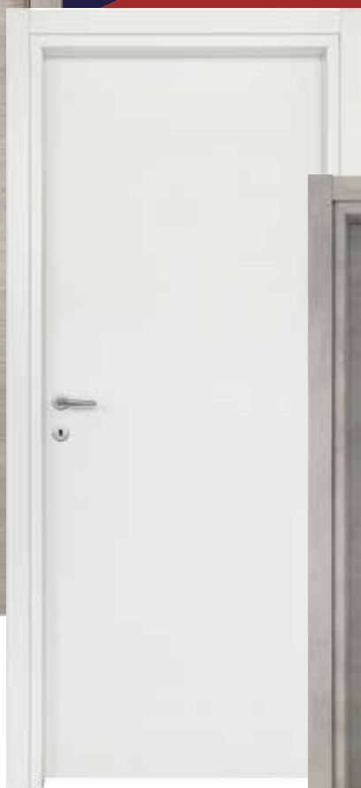
▶ REVE ◀