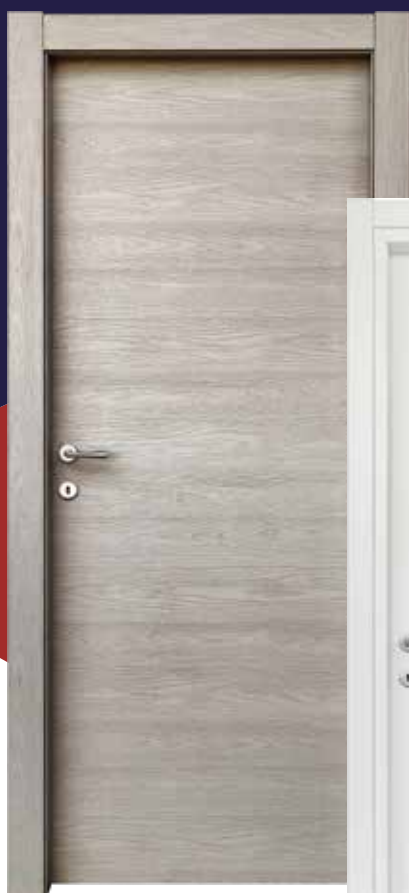
▶ REVELUX ◀